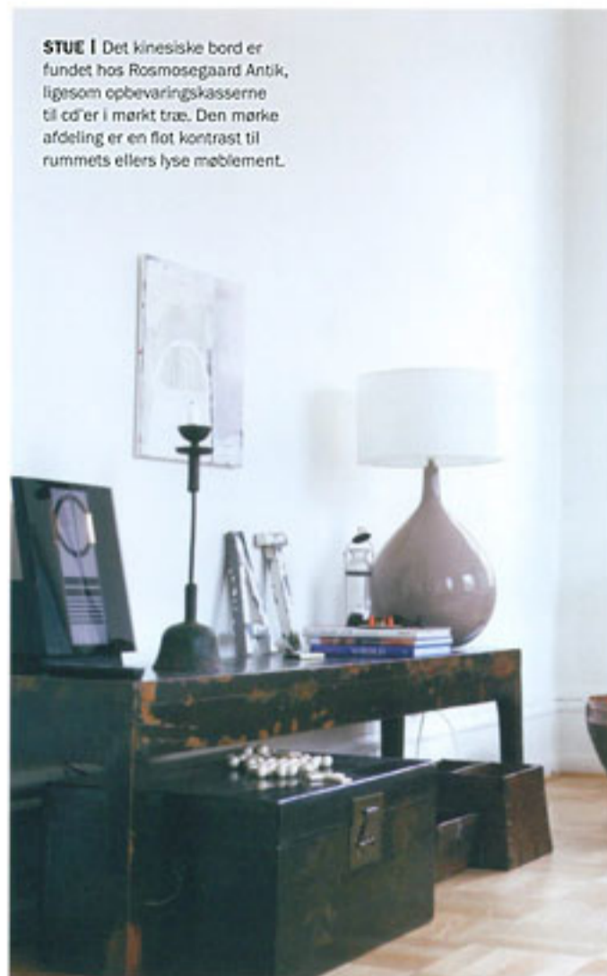
STUE | Det kinesiske bord er fundet hos Rosmosegaard Antik, ligesom opbevaringskasserne til cd'er i mørkt træ. Den mørke afdeling er en flot kontrast til rummets ellers lyse møblement.