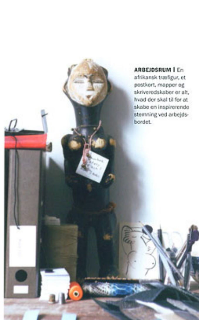
ARBEJDSRUM | En afrikansk træfigur, et postkort, mapper og skriveredskaber er alt, hvad der skal til for at skabe en inspirerende stemning ved arbejdsbordet.