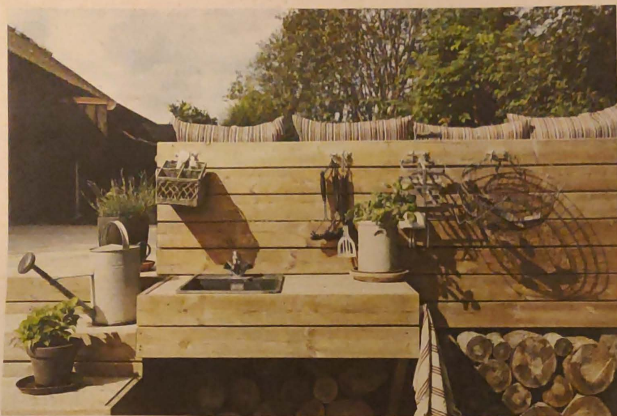
Bag den store bænk og nedenfor trappen til den store terrasse ser man her udekøkkenet. En enkelt opbygning med de fornødne funktioner. Og ikke mindst tæt på langbordet.