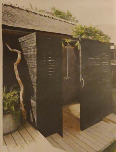
Udebadet er som en sort boks i træ, der er sat på huset, med en dør, der fører ind til både ude- og indebad, om man vil.