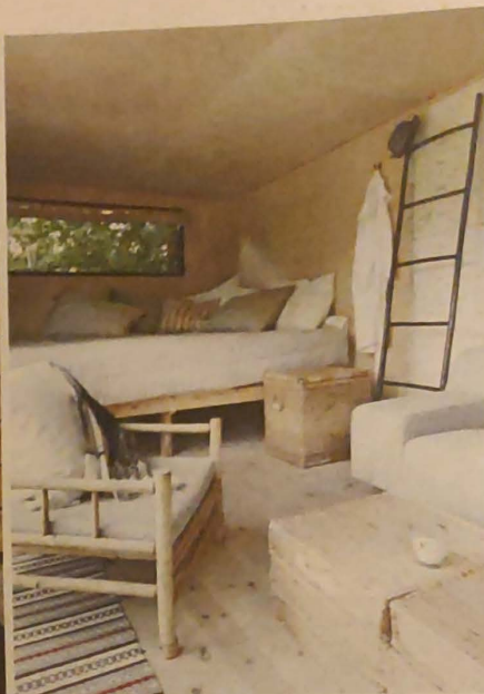
Det lille træhus i haven er beklædt med birketræ på væggene. Og så er der ellers væg til væg-seng.

sele vinduespartier. De store glasdøre, der er sat i overalt i huset, skaber i det hele taget en flydende overgang mellem inde- og uderum på sympatisk vis. Der er isoleret overalt, og alle moderne faciliteter er etableret.