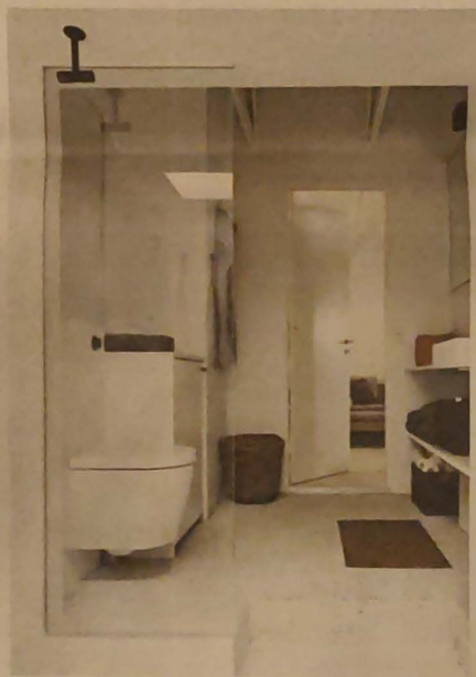
Badeværelset set fra døren til haven er med gulv lavet af hvid beton med strandskaller i og hvid sanitet med glasvæg.

Udenfor ved den store terrasse er der lavet udekøkkenet med alle faciliteter. Og der er opført et hus i haven til de unge mennesker, der følger med, når parrets i alt tre teenagebørn tager med i sommerhuset. De har ofte vennerne med, og der er nu blevet plads til en del mennesker med to mindre huse på grunden, der med garanti er fuldt belagt under Musik i Lejet-festivalen. Den store terrasse såvel som spisebordet indenfor rummer mange mennesker, uanset om det er familie eller vennerne, så er der lavet plads til dem.