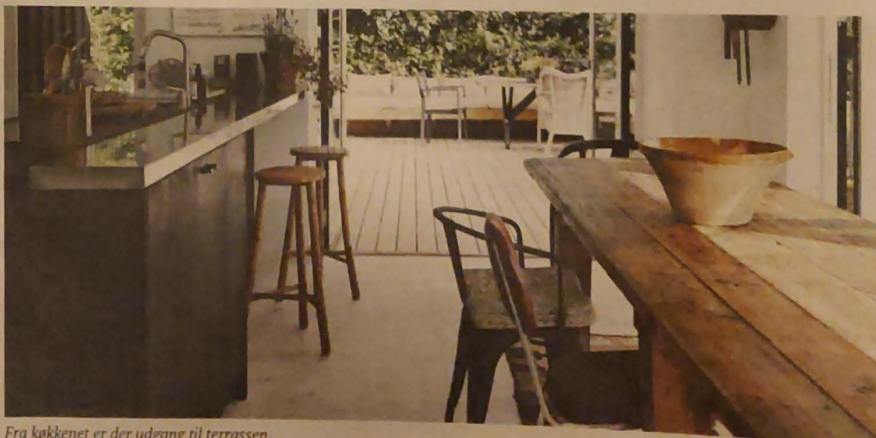
Fra køkkenet er der udgang til terrassen.