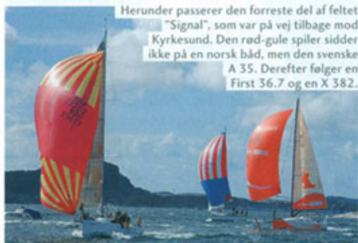
Herunder passerer den forreste del af feltet "Signal", som var på vej tilbage mod Kyrkesund. Den rød-gule spiller sidder ikke på en norsk båd, men den svenske A 35. Derefter følger en First 36.7 og en X 382.