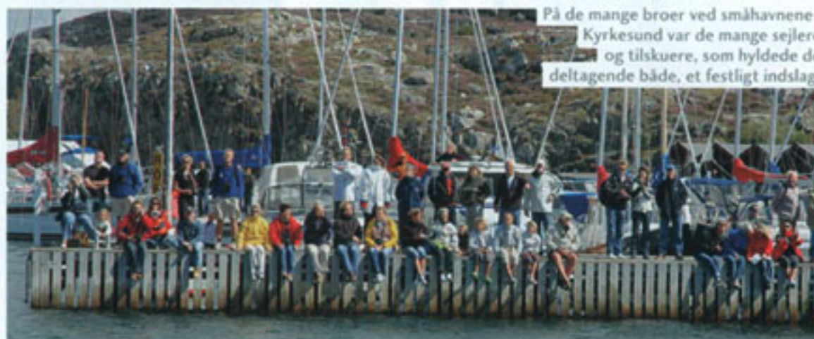
På de mange broer ved småhavnene i Kyrkesund var de mange sejlere og tilskuere, som hyltede de deltagende både, et festligt indslag.

de på begge sider af sundet er samlet for at hylde sejlådene, når de passerer. Folk sidder på deres terrasser eller klippekraningerne tæt på vandet og nyder en god frokost i det gode vejr, som det trods alt var. Der blev også afspillet en stor fanfare fra højtalere, og speakeren annoncerede, at nu kom den første båd i Tjörn Runt, den danske båd "Bukseknæderen", som den stadig kaldes i Sverige.